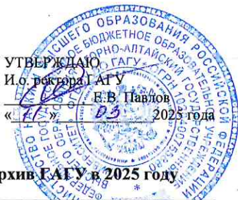
ГРАФИК сдачи документов подразделений в архив ГАГУ в 2025 году